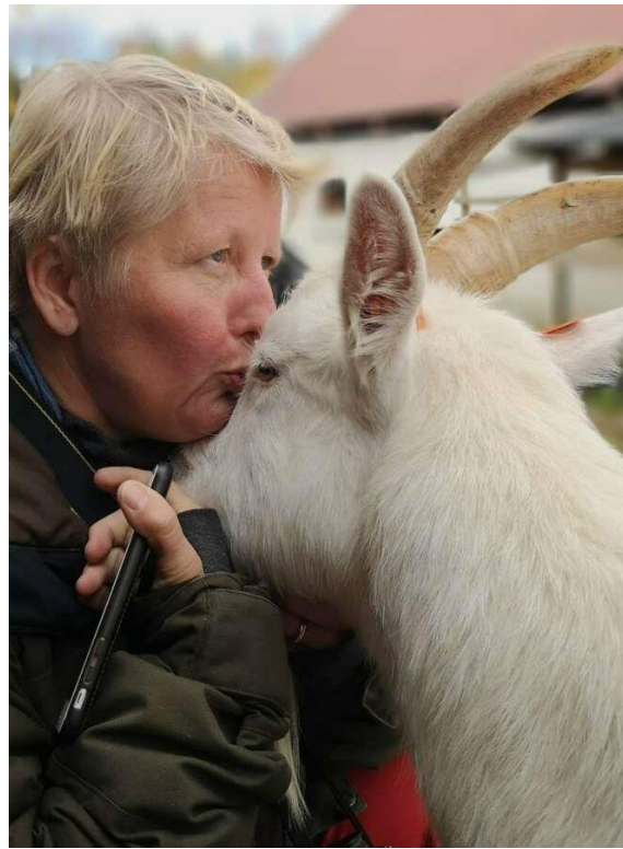
NOR Line Sandstedt Lector in science